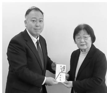
(宗)親奥院様よりご寄付を いただきました