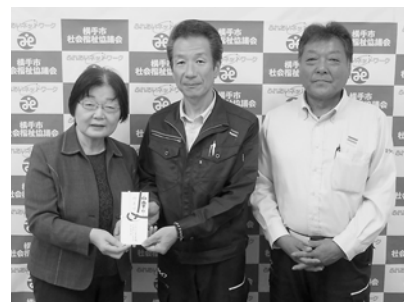
ミライフ東日本(株)十文字HCショップ 十文字店様よりご寄付をいただきました