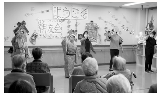
朝友会様よりデイサービスで歌や踊りを 披露していただきました