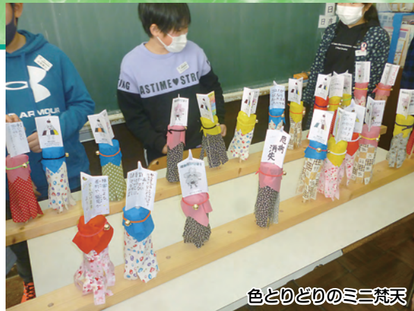
色とりどりのミニ梵天

を届けたいとの思いから、4年生児童が48本のミニ梵天を一生懸命作り、増田福祉センターを通じて、老人福祉施設へお届けしました。施設の皆さんは、例年以上に大きく豪華で立派な“ミニ梵天”を大変喜ばれ、感謝の言葉をいただきました。