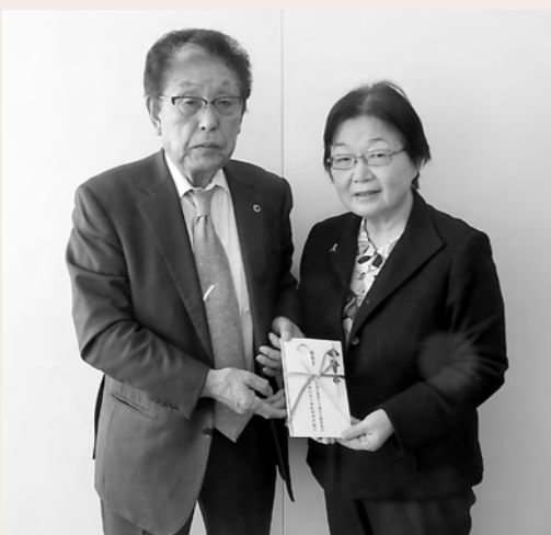
横手地区安全運転管理者協会様、横手地区事業主交通安全推進協会様よりご寄付をいただきました