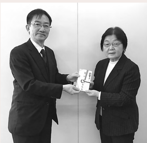
真如苑・親奥院様よりご寄付をいただきました