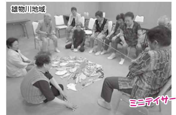
ミニデイサービス