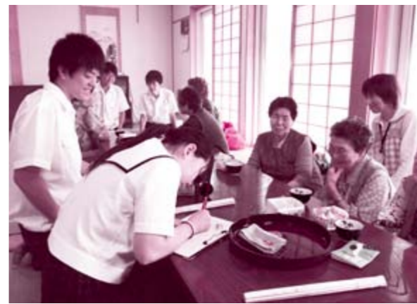
緊張しながらも熱心に聞き取りを行っていました

同校では、農作物の栽培や販売を通して地域との交流を深めており、今回の調査により更に「ふれあい」を深めながら、地域に貢献できる活動へとつながることを期待しています。