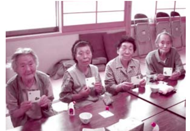
心を込めながら世界に一つだけのコースターを作りました

6月16日(火)と23日(火)、大森地域の自立者支援通所事業において、無地のコースターに好きな模様を貼りつけて作る“世界に一つだけ”のオリジナルコースターづくりを行いました。