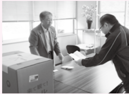
雄川大学の学生一同様よりティッシュをご寄贈いただきました