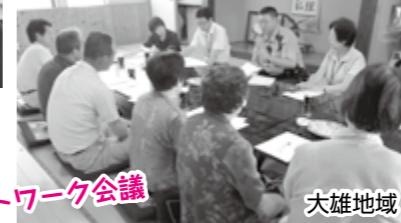
ネットワーク会議