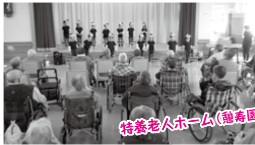
特養老人ホーム(龜寿園)