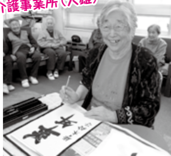
通所介護事業所(大雄)

横手市より五つの老人福祉施設を譲与され、これまでの経験を活かして地域に開かれた施設運営を図りました。また、介護保険事業や障がい者福祉関係事業においても、より質の高いサービスの提供に努めました。