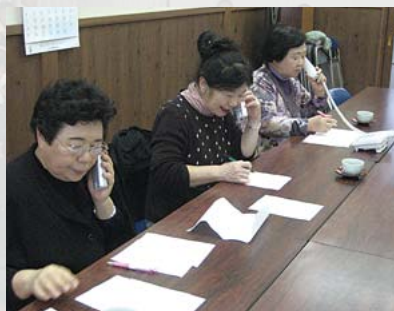
会員が交代しながら毎月1回「声の訪問活動」を行っています

婦人会の皆さんは、「これからも『自分たちが住みたい』と思える地域であるよう、地域に貢献できる活動を続けていきます」とお話しくださいました。