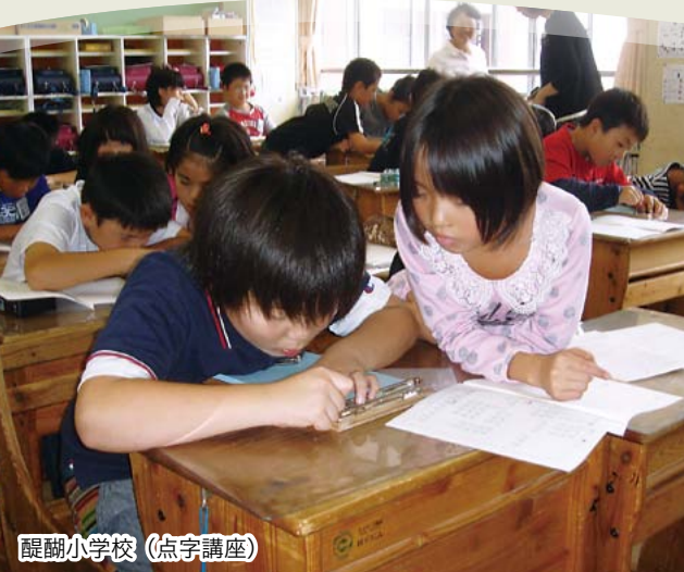
醜翻小学校 (点字講座)