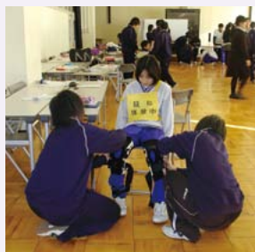
昨年の福祉交流学習の様子(今年も11月に実施しました)

あと数ヶ月で生徒たちは社会に出ていきます。「進路は違っても、人と関わって生きていくことに変わりはなく、一人ひとりが地域を盛り上げていけるように一層がんばっていきたい」と、最後に意気込みを語ってくれました。