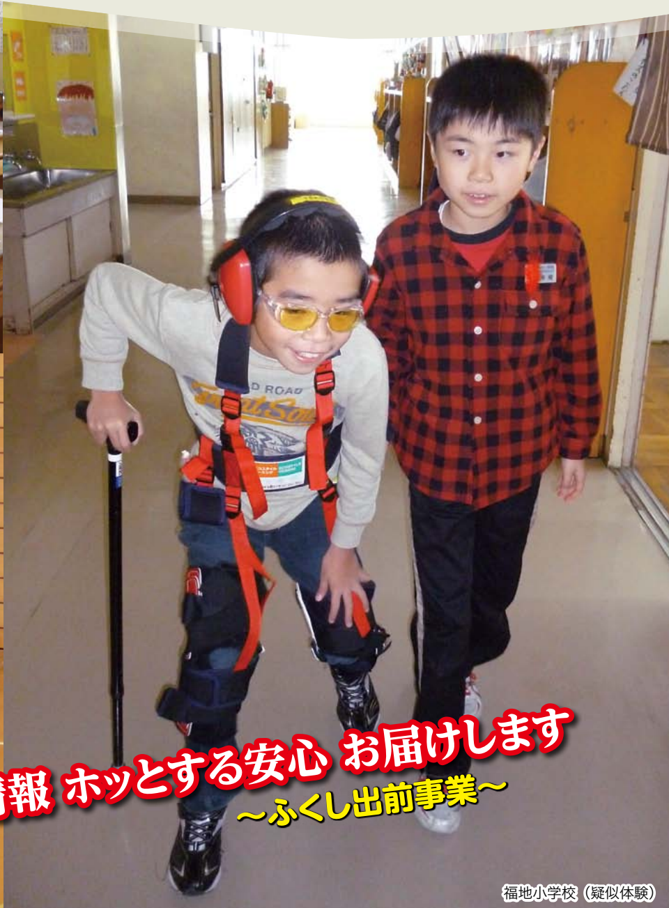
福地小学校 (疑似体験)