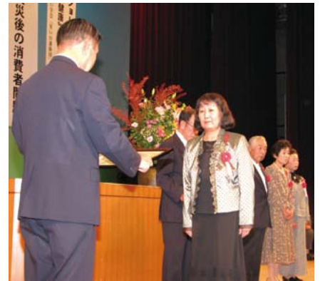
功労・善行のあった方々、団体に表彰状及び感謝状を贈呈しました

講演及びトークショーは秋田県生活センター、秋田県金融広報委員会との共催によるものです。