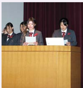
大会では9名の生徒に発表していただきました

本大会にご参加・ご協力いただきました皆様に、また「福祉の標語」や意見発表等にご協力いただきました学校関係者や児童、生徒の皆様にも心より御礼申し上げます。