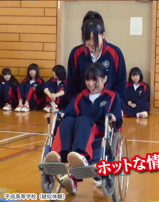
平成高等学校 (疑似体験)