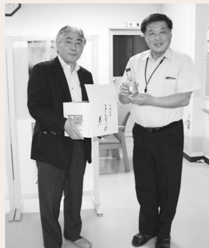
日の丸醸造株式会社様(左)より消毒用アルコール(高濃度エタノール [AKITA75])をご寄贈いただきました