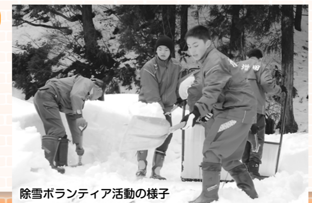
除雪ボランティア活動の様子

雪が少なく増田地域で延四件の活動となりましたが、地元の増田中学校の生徒や先生が参加し、お一人暮らしの高齢者宅で除雪ボランティア活動を行いました。