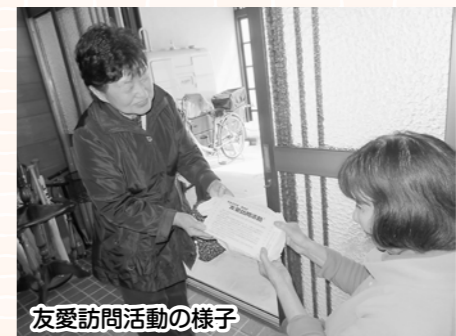
友愛訪問活動の様子

傾聴ボランティア団体や精神保健事業所の協力により、相手の気持ちに寄り添いながらお話を聴く「傾聴ボランティア」の養成講座を開催しました。