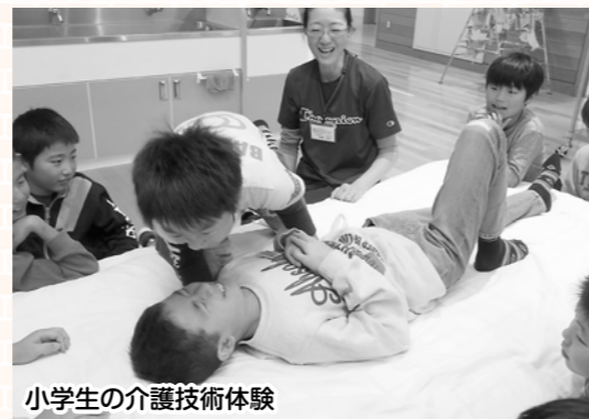
小学生の介護技術体験

市内二十五校の福祉教育活動推進校をはじめ、各学校が行う福祉学習・行事などに協力するなど、地域や学校との協働による福祉人材の育成に努めました。