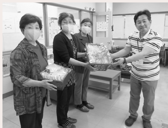
横手市生活研究グループ様(左より)手作りマスクをご寄贈いただきました