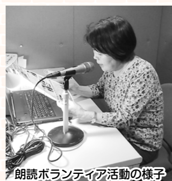
朗読ボランティア活動の様子

朗読ボランティアさんさくの会と点訳ボランティア六星会の協力により、市報や議会だよりなどを音訳・点訳した広報を作成し、視覚障がい者等にお届けしました。