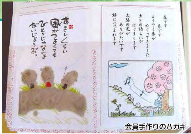
会員手作りのハガキ

施設で生活されている方はハガキの文面から季節を感じ取っていただいているようです。