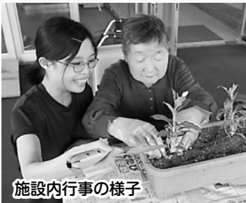
施設内行事の様子

市内の3施設において、生活上のお世話や各種行事のほか、外出等も交えながら日々の生活のお手伝いをさせていただきました。