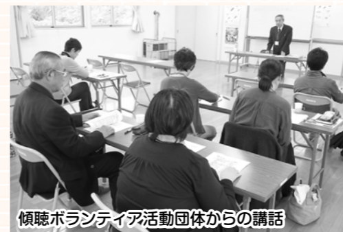
傾聴ボランティア活動団体からの講話

傾聴ボランティア団体や精神保健事業所の協力により、相手の気持ちに寄り添いながらお話を聴く「傾聴ボランティア」の養成講座を開催しました。