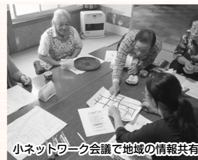
小ネットワーク会議で地域の情報共有

市内一〇七地区で会議・座談会を開催し、地域の現状や支援が必要な方に関する情報交換などのほか、災害時の避難支援体制の構築に向けた協議などを行いました。