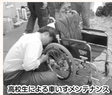
高校生による車いすメンテナンス

生活支援の取り組みとして延一四件の車いすの貸出を行いました。なお、横手清陵学院高校の生徒に貸出用車いすのメンテナンスと修理を行っていただきました。