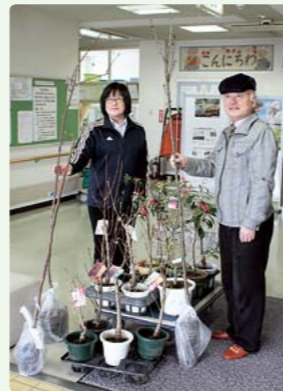
よこて市商工会サービス業部会様より 植木を寄贈いただきました。