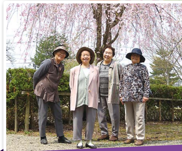
ミニデイお花見会

..... 5.15 ☀ ~ 19 ☀ / ゆうらく館 山内地域のミニデイご利用者が囲碁ボールを行いました。狙い通りに飛ばない玉に、競技している人も見学している人も一緒になって笑いながら楽しく体を動かしました。