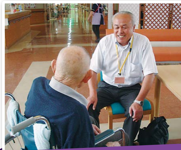
傾聴ボランティア来苑

旧小学校区で開催しているので会場まで来るのが難儀な方を世話人が送迎し、多くの方が参加できるように助け合っています。また午前からは地区伝統の大沢盆踊りを行う等、参加者が飽きないよう工夫しています。これからも様々な内容を企画しながら開催していきます。