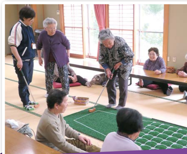
ミニデイレクリエーション

..... 4.26 ☀ / 十文字ふれあい館 委嘱状の交付の他、事業計画や福祉協力員の活動や役割などについて説明しました。参加者から「不安はあるけれども気負わずに活動しようと思う」といった声が聞かれました。