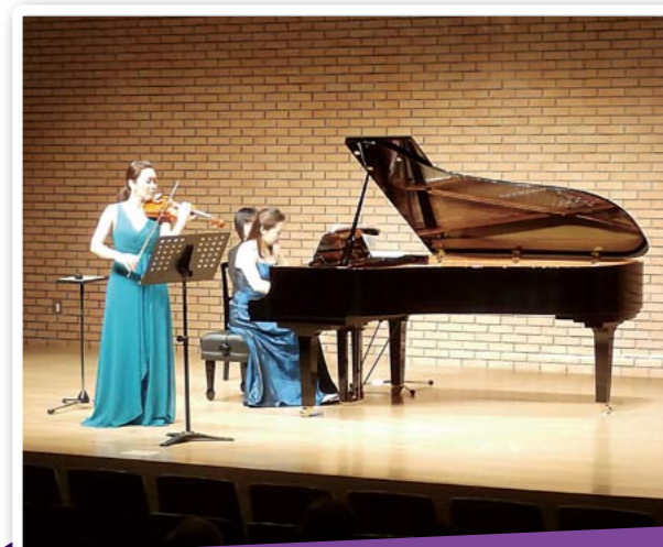
ハイレンデムジーク チャリティコンサート

..... 5.1 ☀ / 雄物川民家苑「木戸五郎兵衛村」 大森地域のミニデイご利用者がお花見に行きました。当日は天候にも恵まれ、しだれ桜を眺めながら「きれいに咲いているね」などの会話も弾み、ご利用者の笑顔も満開になりました。