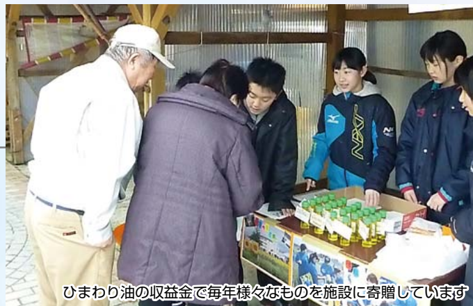
ひまわり油の収益金で毎年様々なものを施設に寄贈しています

て地域の方々から助言を受け、自然や生命のこと、自分たちが地域の一員であること、協力し合うことの喜びを学ぶことができました。