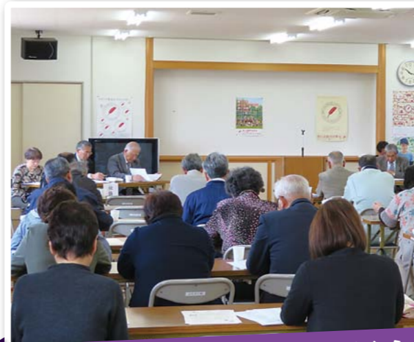
十文字地区福祉協力員会総会

..... 4.18 ☀ / 憩寿園 桜餅作りを行い、一人で10個以上作った方もいてご利用者の手先の器用さには驚かされました。庭の桜はまだ蕾でしたが、桜餅を食べて春の訪れを感じることができました。