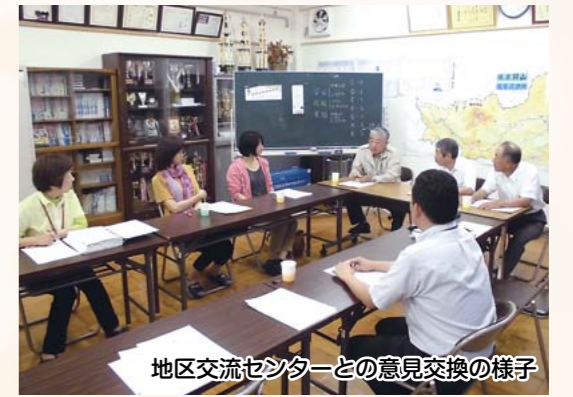
地区交流センターとの意見交換の様子

全世帯を対象としたアンケート調査の結果、地域に必要な取り組みで一番多かった意見が「交流の場」でした。しかし、この結果を基に各地域で意見交換を行ったところ、地域にはすでに多くの交流活動があることがわかりました。こうした交流活動をチラシで紹介したり、実践発表の機会を設けるなど広く情報発信し、地域交流の促進を図っていきます。