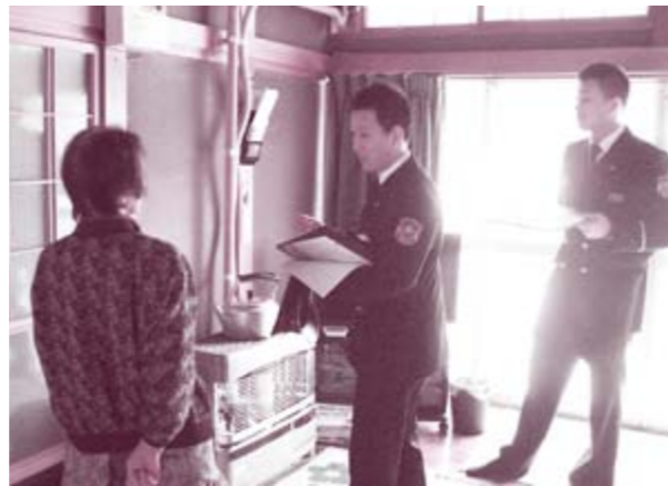
火の元の安全確認や生活の状況についてお伺いしました

11月4～5日、横手市消防署山内分署と合同で高齢者世帯への訪問活動を行いました。今回は7世帯への訪問でしたが、春から一人暮らしの世帯など計37世帯に訪問しており、生活で不便なことがないか、緊急時の連絡先や火の元は安全かなどを確認しているほか、福祉サービス等の質問にもお答えしています。