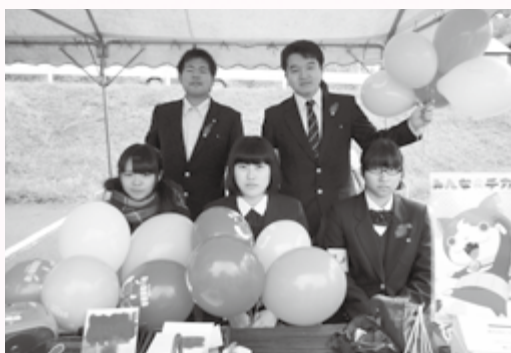
十一月三日(火)の赤い羽根共同募金運動の街頭募金にもご協力いただきました

今後も、生徒の皆さんが様々な経験を積み重ねながら成長し、地域に貢献し続けてくれることを期待しています。