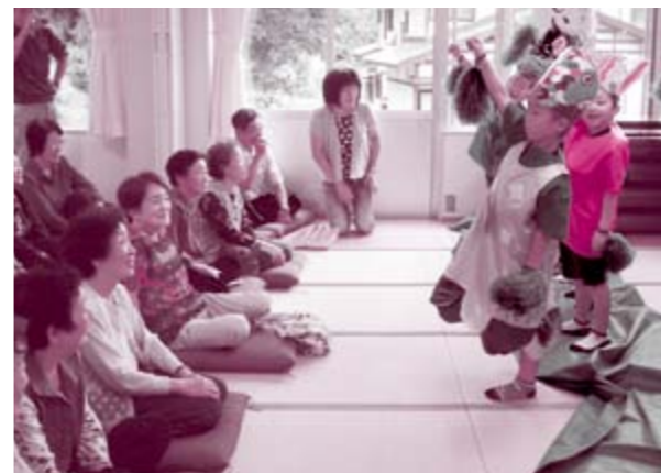
子どもたちの一生懸命な姿を温かい笑顔で見守っていました

同校では、毎年、地域の福祉施設で歌や踊りなどの演芸ボランティア活動を行っており、昨年度からはサロンに出向いて地域の方々と交流を深めています。「また交流したい」との声が聞かれ、児童や参加者にとって有意義な交流会になったようです。