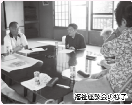
福祉座談会の様子