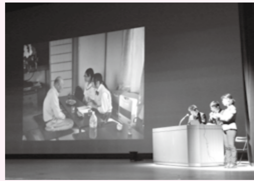
県立平成高等学校インターアクト部「聞き書きボランティアについて」

同校インターアクト部の活動は8ページの「ふくしな人たち」に掲載しております。 同校インターアクト部の生徒より、平成二十五年度から取り組んでいる「聞き書きボランティア」について、活動の目的や内容、感想などを、活動中の「実践」も交えながら発表していただきました。