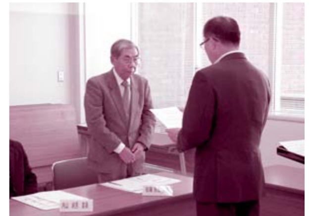
委嘱された14名の皆様と共に地域の福祉を推進して参ります

10月22日(木)、市と一体的に策定した「横手市地域福祉計画・地域福祉活動計画」の第1回推進委員会がかまくら館で開催され、委員への委嘱状交付や今後の進め方などの説明が行われました。