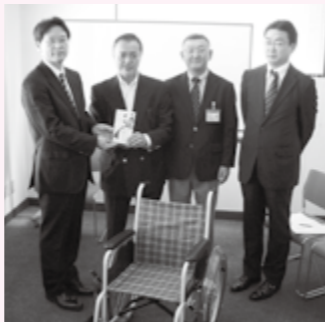
北東北雪印メグミルク協会秋田支部様より、本会を通じて特別養護老人ホーム「ビハール」横手様へ車いす三台が寄贈されました。