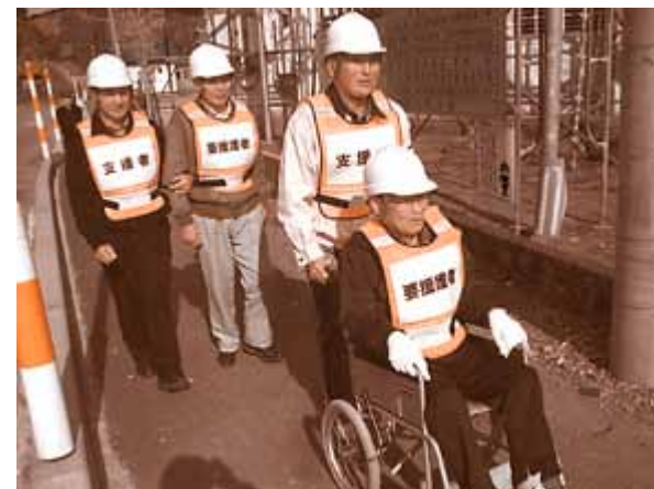
地域の情報把握により円滑な避難誘導ができました

こうして作成したマップの情報を関係者間で共有し、11月8日(土)の避難訓練では、迅速な避難誘導へとつながりました。