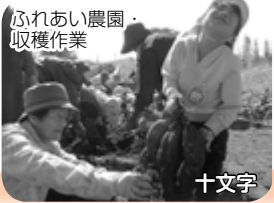
ふれあい農園・収穫作業