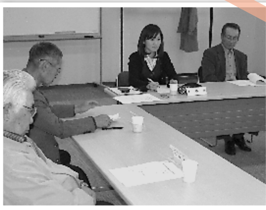
11月7日(金)、遺族連合会の会議に出席し、研修会の打ち合わせなどを行いました。

次号1月1日号には「夢」をテーマとした作品を掲載します。(募集終了) 今年も残りわずかとなりましたが、皆様の作品で彩る「ふくし川柳」を来年もよろしく お願いいたします。皆様にとって幸多き年となりますように。