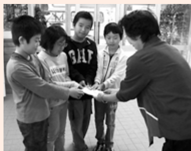
南小学校4年生児童より、自分たちが栽培し販売したスイカの売り上げをご寄付いただきました。