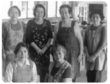
横手城南高校銀杏同窓会大森支部(大森)

昭和五十四年の結成より福祉施設などで清掃やタオルたたみ、タオルの寄付などの奉仕活動が続けられてきました。団体での活動以外にも、ボランティアとして様々な機会でも活躍されています。地域福祉の推進に貢献されています。