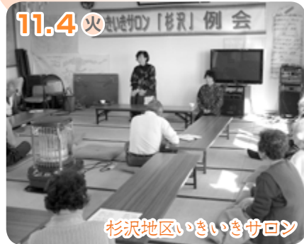
11.4 火 地域の「暮らし」例会