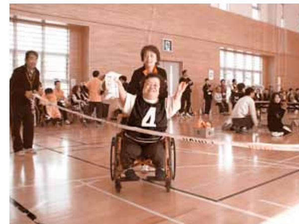
みんなで協力しあいゴールをめざしました

10月19日(日)、さかえ館を会場に身体・知的・発達などに障がいのある方々と市内のボランティア、学生によるスポーツ交流が行われました。