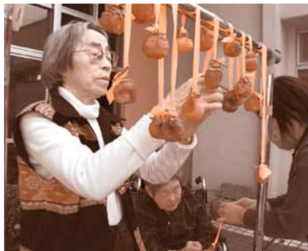
一番おいしい食べごろを確認しています

10月31日(金)、雄水苑においてご利用者の皆さんと秋の味覚「干し柿」づくりを行いました。干し柿にする柿は、ご利用者様のご自宅からのいただきもの。毎年この時期になると色鮮やかな柿をお届けいただいております。