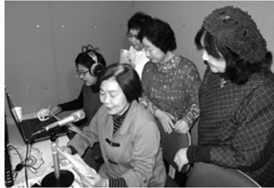
二十年以上にもわたってめくもりある声を届けてきました

朗読ボランティア「まんさく」の会は、平成2年に旧横手市社協主催の朗読ボランティア養成講座の修了生を中心に設立され、これまで横手市報や議会だよりなどを音訳し「声の広報」として視覚障がい者の方々にお届けしております。