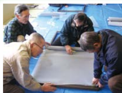
シニア世代ボランティアの育成(父ち ゃんの楽校: 網戸修繕ボランティア)

その他にも次の活動に 使わせていただいています 心配ごと相談所・無料法律相 談所開設費、シニア世代ボラン ティア育成費、災害ボランティア センター開設準備費、福祉の標 語募集経費、お一人暮らし高齢者 と児童との交流活動費、社協だ よりの発行費、社会福祉大会開 催費、地域福祉活動計画策定費