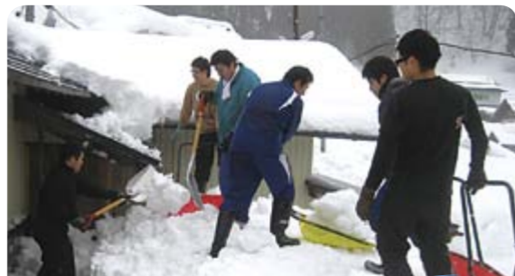
山内地域での除雪ボラ ンティア活動