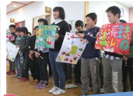
大雄地域の田根森小 学校による施設訪問活動