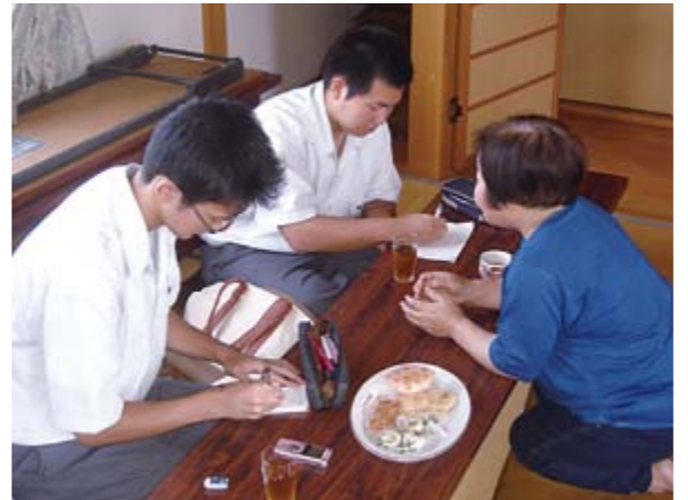
緊張も徐々にほぐれ会話も進みました

この活動は秋田大学の「地・知の拠点整備事業」の一環として行っているもので、9月18日(木)は横手城南高校の生徒が活動したところです。