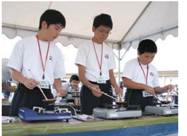
中学生ボランティアも学校での活動をPR

9月21日(日)、横手市役所条里南庁舎向かい駐車場を会場に、横手市ふれあいフェスティバルを開催しました。