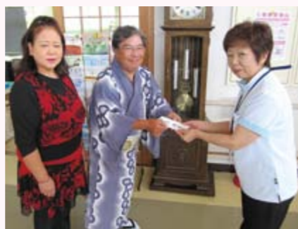
歌王会様よりチャリティ大会の収益金をご寄贈いただきました。