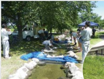
地域に根差す企業としてイベントへの協力や環境保全に努めています

他にもクリーンアップや花の植栽作業などに協力されており、これからも人と人とが笑顔でふれあう地域社会の実現のために活動を続けられます。