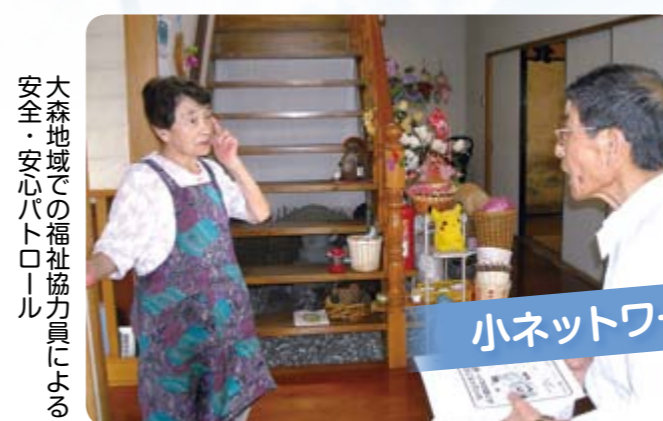
大森地域での福祉協力員による 安全・安心パトロール