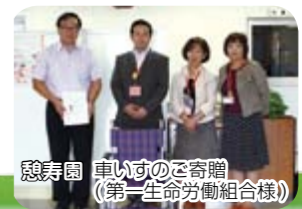
憩寿園 車いすのご寄贈 (第一生命労働組合様)