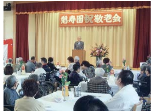
ご家族様と一緒に長寿をお祝い

敬老の秋、本会の特別養護老人ホームで敬老会が行われ、ご家族様をお迎えし、ご利用者様の賀寿と長寿をお祝いしました。