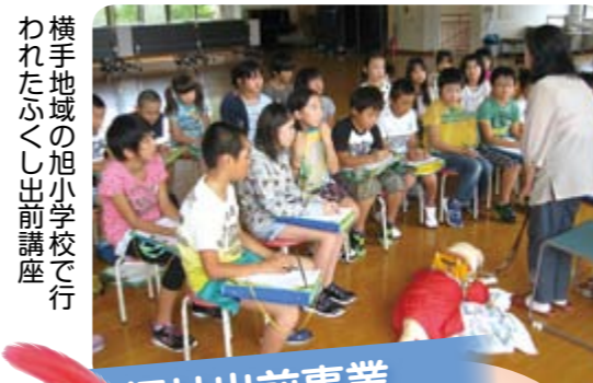
横手地域の旭小学校で行 われたふくし出前講座

その他にも次の活動に 使わせていただいています 心配ごと相談所・無料法律相 談所開設費、シニア世代ボラン ティア育成費、災害ボランティア センター開設準備費、福祉の標 語募集経費、お一人暮らし高齢者 と児童との交流活動費、社協だ よりの発行費、社会福祉大会開 催費、地域福祉活動計画策定費