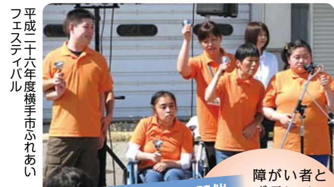
平成二十六年横手市ふれあい フェスティバル