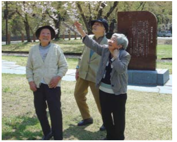
「そよかせ」舞う真人公園で春を感じてきました

5月8日(木)、増田地域の自立者支援通所事業(ミニデイサービス)で地元の蔵や酒造工場、真人公園へ散策に出かけ、春の一日を楽しんできました。