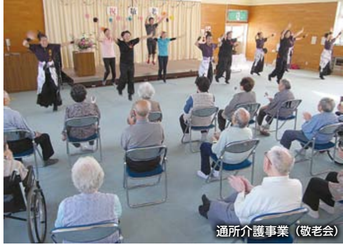
通所介護事業（敬老会）