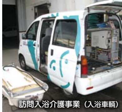
訪問入浴介護事業（入浴車輛）