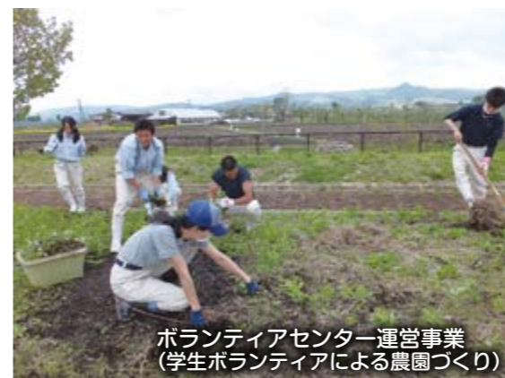
ボランティアセンター運営事業（学生ボランティアによる農圃づくり）