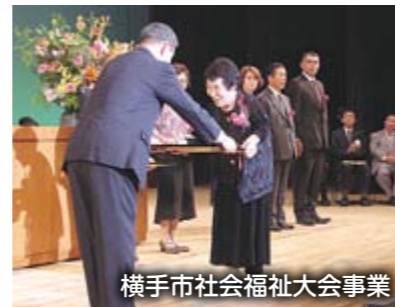
横手市社会福祉大会事業

老人福祉施設の譲与を受け、本会の特色を活かし地域に開かれた施設運営を図ると共に、各事業所においても社協内外の関係事業所等との連携を強化し質の高いサービス提供に努めます。