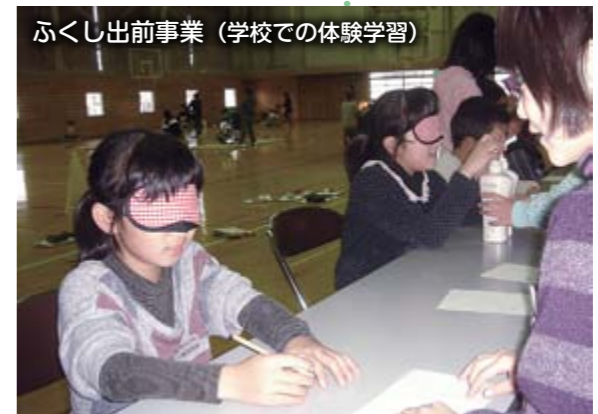
ふくし出前事業（学校での体験学習）