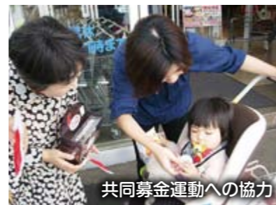
共同募金運動への協力

▼社協だよりの発行▼社協会員拡大運動▼社会福祉大会の開催▼事業評価検討会議▼地域福祉活動計画の策定▼福祉団体の支援（老人クラブ、身体障害者福祉協会、遺族会、手をつなぐ育成会）▼共同募金運動への協力