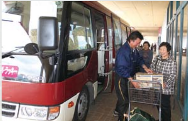
たくさん買っても大丈夫。運転手さんが積み荷のお手伝いをしてくれます

また、地元の業者と協力しながら各種相談にも対応されるなど、今後も地域の困りごとの解決につながる地域密着の活動を継続されていくとのことでした。