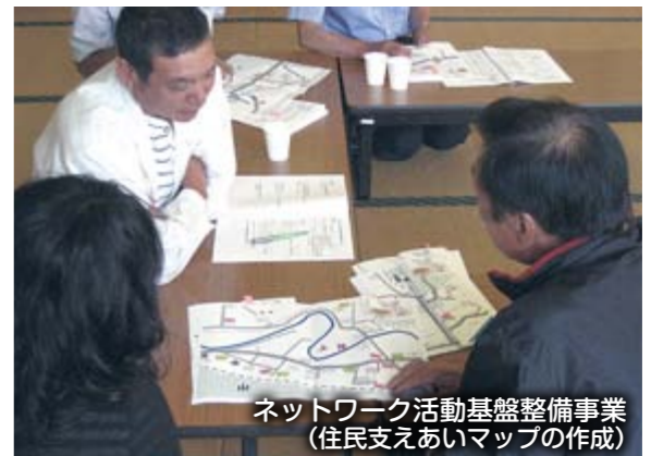
ネットワーク活動基盤整備事業（住民支えあいマップの作成）

誰もが安心して暮らすことのできる地域づくりをめざし、地域住民や関係者・機関等と連携しながら、地域の福祉ニーズや課題に対応した地域福祉活動を推進します。