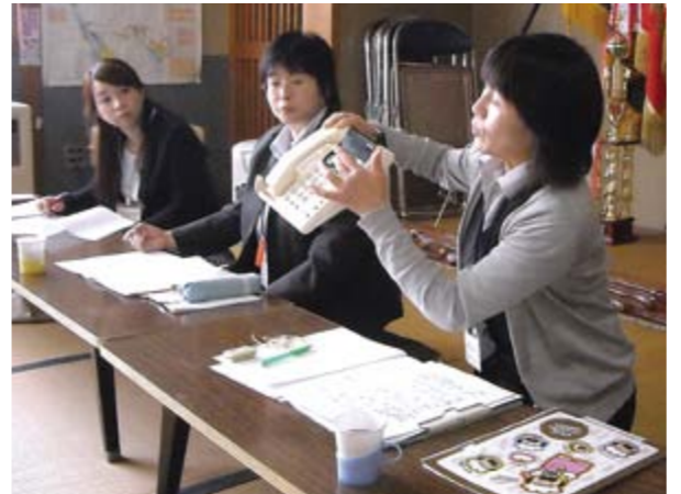
実際の安心電話を用いて使い方などを再確認しました

研修会では「緊急時の支援体制づくりはもちろんだが、普段の見守り体制についても考えることが大切」との意見も出され、社会福祉協議会ではその地域の想いと活動を今後も支援していきます。