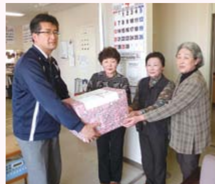
十文字地域老人クラブ連合会女性部様より、本会各施設・事業所に清拭タオルをご寄贈いただきました。(写真は十文字福祉センターへのご寄贈時の様子)