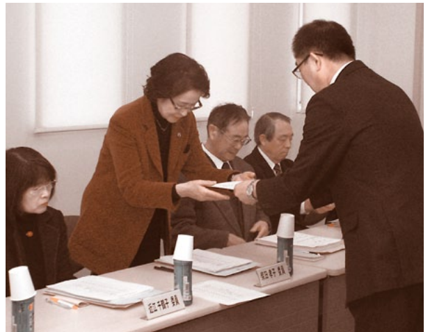
計画づくりの中心となる委員の皆様へ委嘱状を交付しました

3月3日(月)、第1回横手市地域福祉計画・横手市地域福祉活動計画策定委員会が開催され、17名の委員への委嘱状の交付や両計画の概要、今後のスケジュールの説明等が行われました。