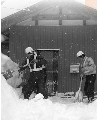
玄関先など生活に繋がる場所を 除雪しました(白川建設㈱)