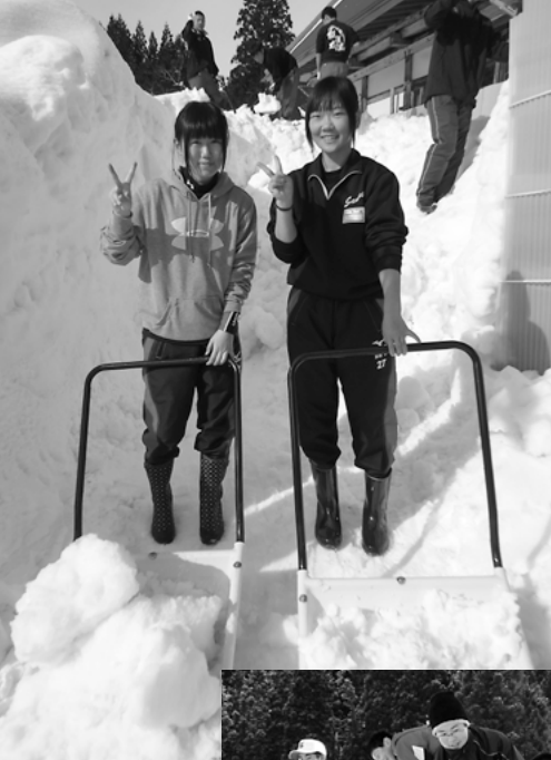
雪の中の“ヴィーナス” (金足農業高等学校)