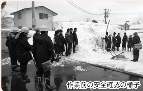
作業前の安全確認の様子

今冬の雪下ろしや除雪作業中の事故が多発したことから、秋田県からの受託事業として「雪下ろし等安全推進事業」を2月から3月に掛けて実施し、専門の職員5名が雪下ろし・除雪の安全指導や地域の巡回などを行って作業中の安全確保に努めました。