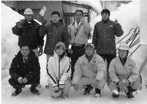
本社と地元 の営業所の社員が 一緒に活動 (株協和)