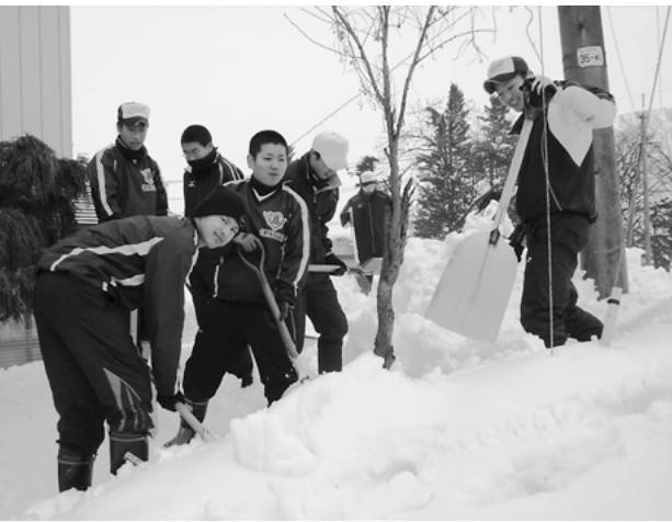
除雪の“トレーニング”で パワーアップ！ (雄物川高等学校)