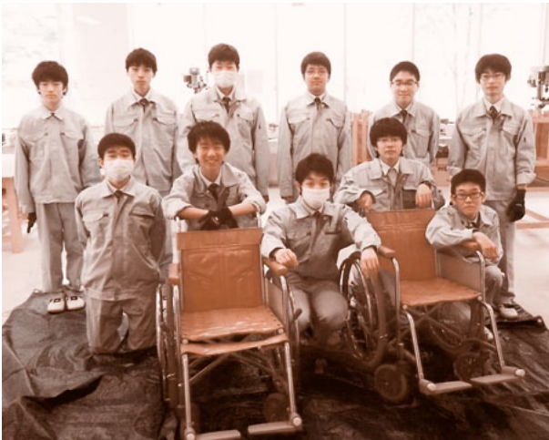
本会提供の車いすが生徒の手で再び活躍の機会を得ることになりました

また同校メカトロ部では、この活動を通して車いすのアシスト機能装置を開発し、県の発明展で優秀な成績を修められました。本会では、今後も児童・生徒の福祉活動を応援していきます。