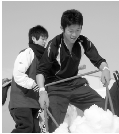
若い力でサクサクと (増田高等学校)