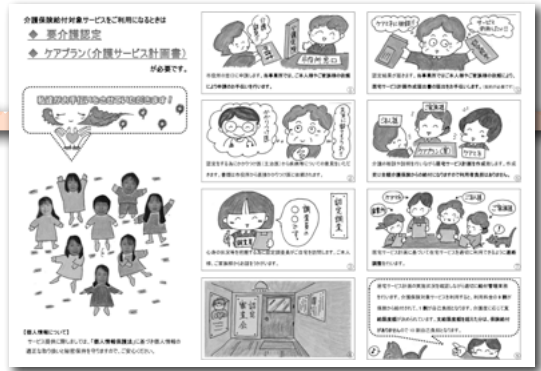
事業所のパンフレット

十文字町健康福祉センター内にある当事業所は、上から下まで幅広い(?)年齢層の8人のケアマネジャーでサービスを提供させていただいています。