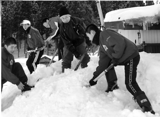
今季で活動六年目を迎えたスノー暖歩隊 (山内中学校)