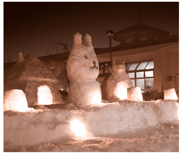
ミニかまぐらのほか様々な雪像をつくりました

憩寿園では、毎年恒例の小正月行事が2月12日(水)に行われました。当日、施設の中庭で職員がミニかまぐらなどの制作に取り掛かり、ご利用者様からの「寒いけどがんばれえ」との声援を背にミニかまぐら100個と犬っこなどの雪像が完成しました。夕方、かまぐら内のろうそくに火が灯されると辺り一面は幻想的な風景が広がり、その風景を前にしながら夕食などの時間を楽しんでいただきました。火が消えた後も名残惜しそうに、そして昔を懐かしむような様子で中庭を覗くご利用者様の姿もありました。