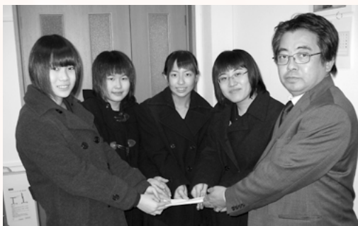
社会福祉協議会に寄付いただきました

4人は学校の総合学習で「難民」をテーマに学習し、自分たちにできることとして、難民に古着を送る活動に参加したいと準備を始めました。