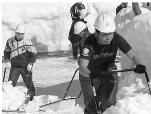
寒い中、半袖で除雪する生徒も (秋田工業高等学校)