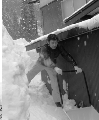
雪の降る中、懸命に作業 (秋田建築労働組合)