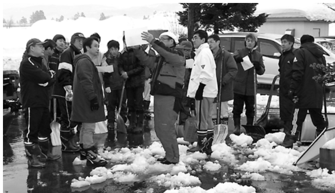
除雪場所の説明を受けてから活動を開始します(株秋田銀行)