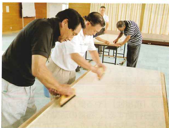
↑もうすでに職人の域に達しています

今年で4年目を迎える「父ちゃんの楽校」の進め方などについて話し合うため、楽校参加者の中から希望者5名が参加し、企画会議を8月25日(木)に大雄ふれあい館にて開催しました。会議の中では「趣味を活かした地域貢献」をテーマに意見交換が行われ、今後の内容や運営について意欲的なご意見をいただきました。