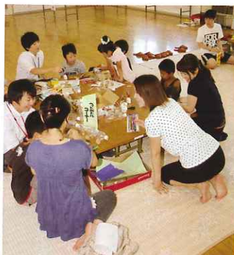
←家族で一緒に奮闘中

「私が作ったものが一番!」と、子どもたちによる見せ合いが終わった後は、自分たちで考えた即興のボーリング大会。笑顔あふれる交流会に、次回への期待の声もいただきました。(次回は冬頃に開催予定)