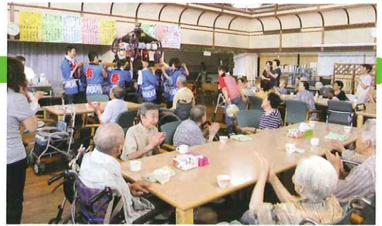
↑平寿苑:本格的な神輿の登場に会場は大盛り上がり

7月下旬、特別養護老人ホーム雄水苑、平寿苑、憩寿園とデイサービス康寿館のそれぞれの施設で夏祭りを開催しました。ご利用者様や地域の方々に楽しんでもらおうと、各施設とも趣向を凝らした様々な催しを行い、参加していただいた皆さんからたくさんの笑顔をいただきました。