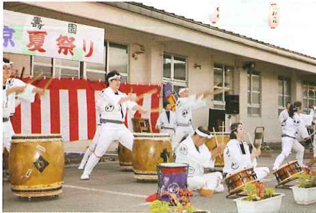
↑憩寿園:祭りの格好もいごど