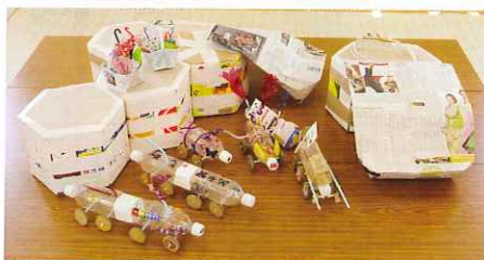
↑みんな納得、会心の出来栄!