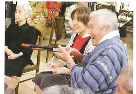
↑康寿館:よしっ!当てど〜!!