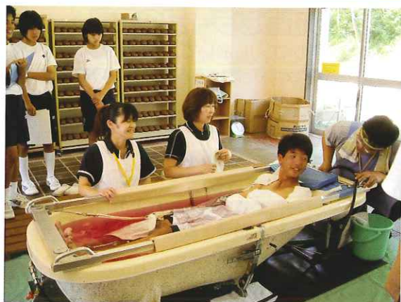
↑湯加減はいかがですか?

7月20日、大森中学校にて訪問入浴車の見学・体験と介護教室が行われました。訪問入浴については、ほとんど目にしたことがないサービスとのことでしたが、今回の教室では実際に入浴体験をし、生徒からは「扱いが丁寧で安心して入浴することができた。実際に介護を受けている方もうれしいのではないかと思います」との感想があり、少しでも理解していただいたのではないかと思います。