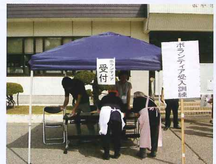
↑地域の方々にご協力いただきました

この地域で大きな災害が起こったら…、増田土肥館地域のような活動と一緒に、我々もとるべき行動を常に点検していきたいと思えます。