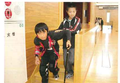
普段は気にならない場所でも…(大森小)