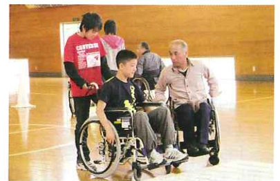
段差を介助してもらいながら(十文字第一小)