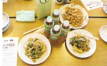
会心の自信作！早く食べたい…