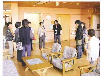
活動場所の確認も熱心に