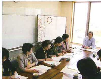
活動の心得などを学びました

「傾聴が必要とされる場で、学んだ内容を活かしてみたい」との、一部受講者の要望により、5月25日と6月13日に特別養護老人ホーム雄水苑で、実戦に向けた研修会が開催されました。これまで学んできた技術と熱い想いを胸に、7月から本格的な活動に入る予定です。