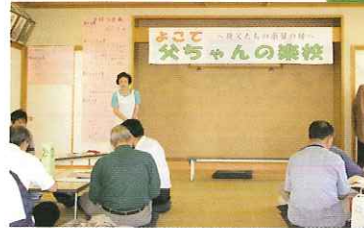
調理の前に不安と期待が混じっています