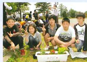
大きな花を咲かせるよ

また、式典後の花植え作業では、色とりどりの花の苗を植えました。今後は4・5年生の児童も参加して水やりなどを行い、育てられた花は福祉施設等へ贈られる予定です。この運動を通じて、人権の大切さについて理解すると共に、福祉の心が育まれることを期待しています。