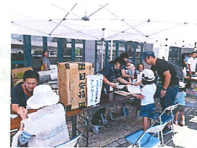
(昨年の様子／福祉・健康O×クイズ、アンケート調査)

十文字生活支援協議体のことを地域の皆さんに広く知ってもらおうと、『まめ☆だすか(ささえあい ネット 十文字)』という愛称にしました。これからも宜しくお願いします。