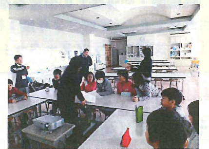
(昨年の授業の様子／小学4年生を対象に実施)