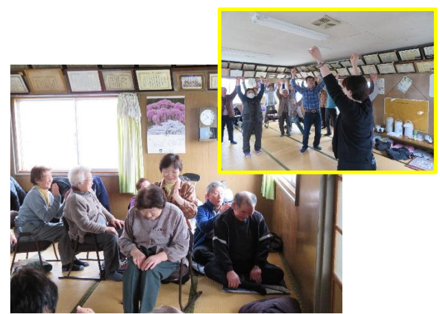
軽体操の後に、お互いに肩たたき。