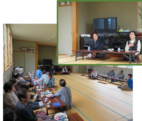
秋田弁での昔がたりを聞きました。