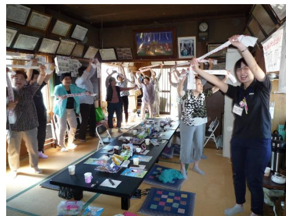
「軽体操で介護予防」 “さわやか体操”を毎回行っています。