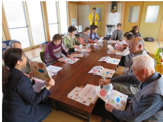
「健康講話」 食事のとり方や栄養バランスなどについて学びました。