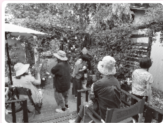
バラ園では多くの出会いと交流が生まれます

みんなが力をあわせて開催することで、住民同士の結束が強くなり、支えあえる関係づくりにつながっているほか、 新たなつながりが生まれる出会いの場 にもなっています。