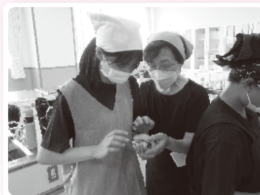
生徒と参加者が協力して料理をつくりました

交流できたほか、学校へ初めて入った方も多く、企画は大いに盛り上がりました。なお、 地元の有志の皆さんや企業などにも協力を呼び掛ける など、実現に向けてみんなが連携を深める場にもなりました。