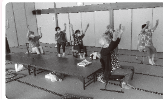
参加者同士で教えあって体操をしました

6月から共林荘を会場に毎月1回の交流会「山内つどいの場」がスタートしました。 送迎により多くの参加者がつどいことができ 、温泉やおしゃべりなどで盛りあがっています。