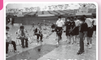
地元の有志が協力し、スマイルポウリングで交流しました