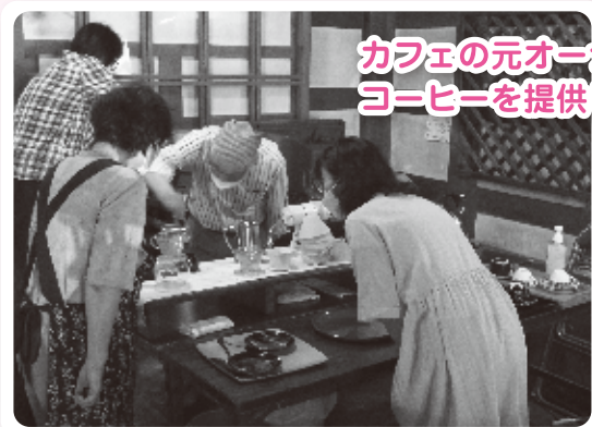
カフェの元オーナーがコーヒーを提供しました

大森町では、美容室/サロン ドエムズのバラ園を中心に、文化財や地域の方々の趣味・特技・つながり・アイデアなどの、 地域のお宝を活かしたイベント が行われています。