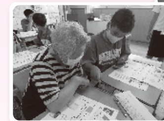
企業と生徒がスマホの使い方を説明しました