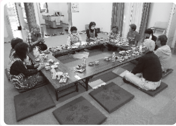
花植え後はお茶っこ飲みをしました

地域の有志が集まる「はなまるクラブ」では、神社へ花を植えたり、プランターを会館などへ設置するなどの美化活動を行っています。