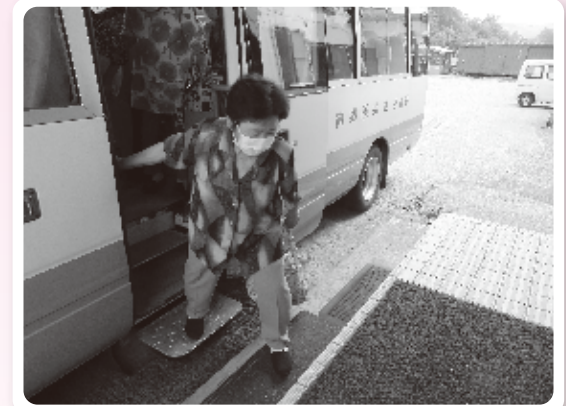
温泉のバスが送り迎えしてくれます

「つどいの場に参加したくても移動手段がなくて参加できない」との声が多ことから、 バスを保有する南郷(夢)温泉 共林荘 と、さんない生活支えあいたい(山内地域協議体)が打ち合わせを重ね、