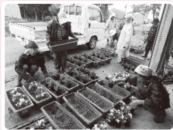
みんなで協力して毎年花を植えます

花植えだけではなく、除草作業などのお世話もしますが、 せっかく集まった機会を大事にして、毎回お茶っこ飲みや芋の子会などを行うこと で、お互いの親睦を深める楽しい時間にもなっています。